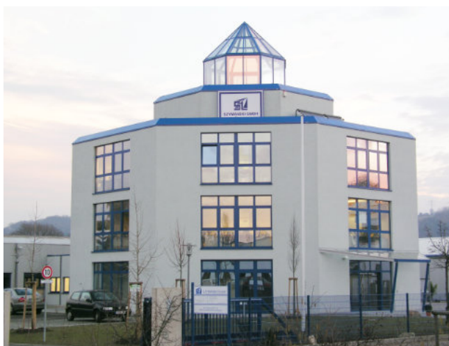
Der moderne Firmensitz der SL Szymanski GmbH in Saarbrücken-Güdingen