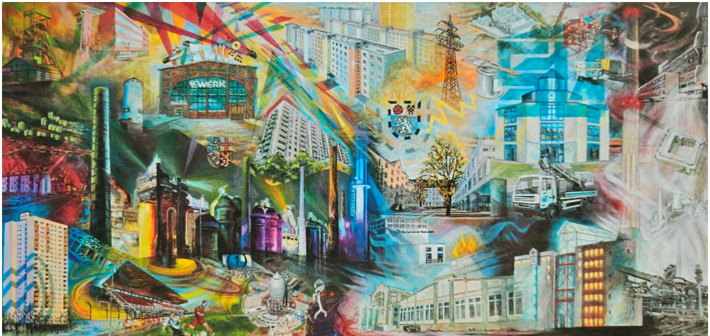
Dieses Gemälde zeigt das Firmengebäude der SL Szymanski sowie mehrere Bauobjekte, an den das Unternehmen in den vergangenen Jahren tätig war