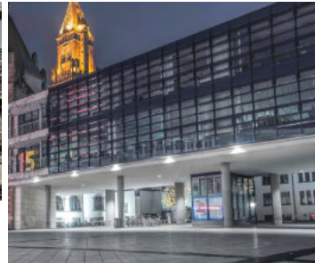
Nur einige der Referenz-Objekte , an denen die Bau-Experten der SL Szymanski GmbH tätig waren: Haus der Wirtschaftsförderung Saarbrücken, Rathaus Wemmetsweiler, Weltkulturerbe Völklinger Hütte, Wasserwerk St. Arnual, Kraftwerk Römerbrücke, Rathaus Carée Saarbrücken und SHG-Kliniken